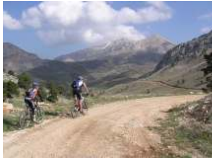
Alpines Gelände bis 2400 m.ü.M.

Mountainbiker lieben ja – wie der Name schon sagt – die Berge, unwegsames Gelände und steinige Wege. Mit über 9000 gefahrenen