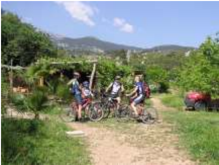
Startpunkt an der Bar vom Camp

bestens geplanten und beschriebenen Touren hieß es morgens immer erst einmal Aufstieg – 1600 hm am Stück (!). Dafür konnten wir dann tolle Landschaften, Canyons, super Ausblicke (auch aufs Meer) und das herrliche Wetter genießen. 2 Gastfahrer aus Berlin schlossen sich bei 2 unserer Touren an und waren danach, obwohl sehr gut trainiert, doch relativ platt. Nach ein oder zwei Runden Efes, dem süffigen türkischen Bier war davon aber nichts mehr zu spüren.